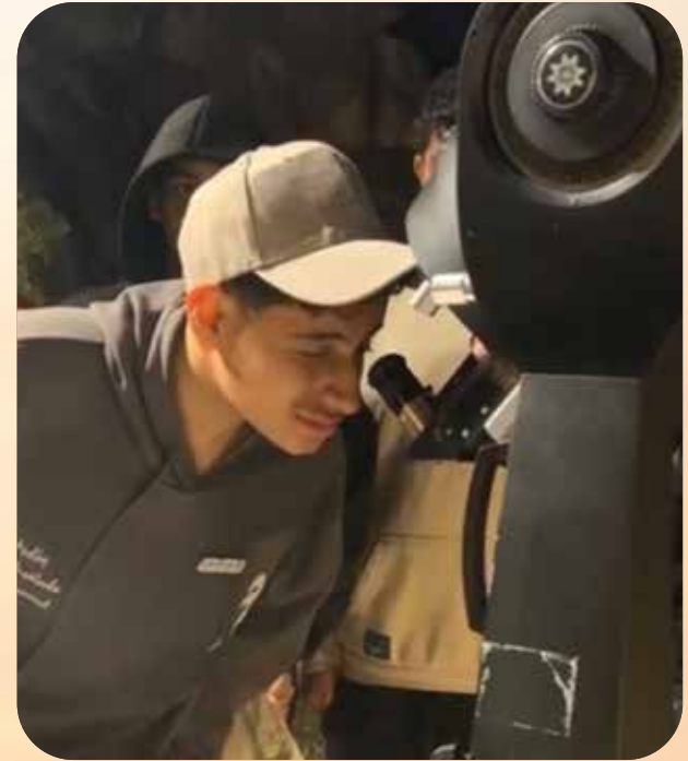
منارة حائل الفضائية