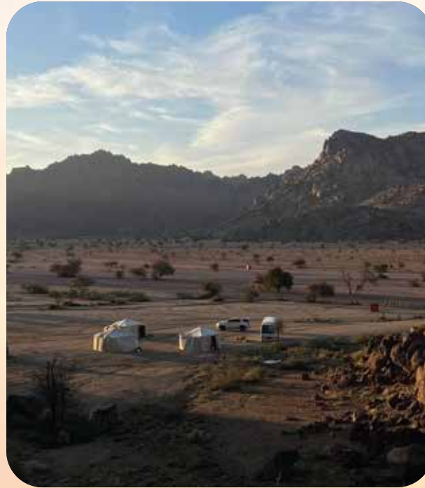
منتزه مشار البري