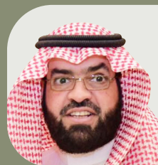
ماجد سليمان الحنيشل نائب الرئيس