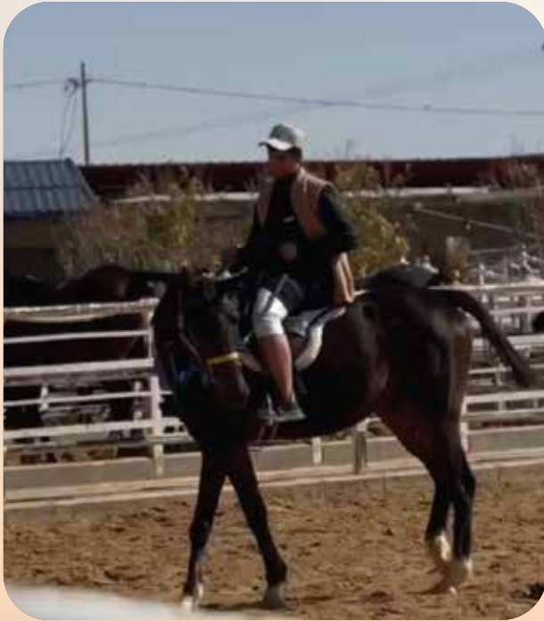
مربط الطائي للخيول العربية